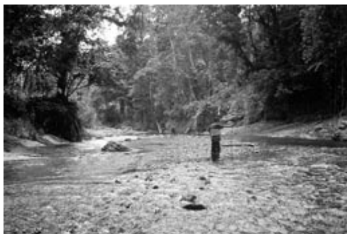
Figura 1. Río Yorkín, territorio indígena Costa Rica, Panamá.

Protocolo ambiental: Realizamos giras, conteo de rastros en transectos, colecta de heces y observación directa (Burnham et al. 1980, Naranjo, 1995a, Naranjo, 1995b, Glanz, 1991, Jorgenson, 1993). La investigación se